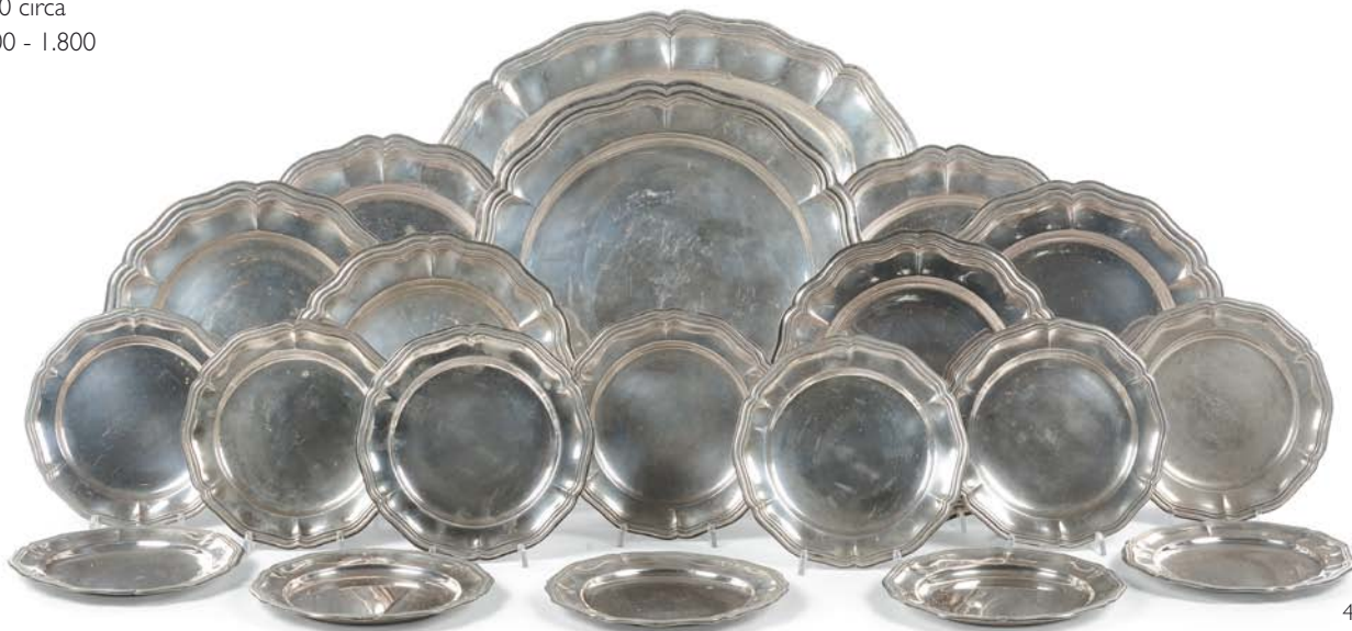
47 SERVITO DI PIATTI IN ARGENTO CON BORDO SAGOMATO gr. 5300 circa € 1.500 - 1.800