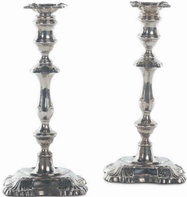
162 COPPIA DI CANDELIERI IN ARGENTO INGHILTERRA 1899 gr. 2070, altezza cm 30 € 1.500 - 1.700