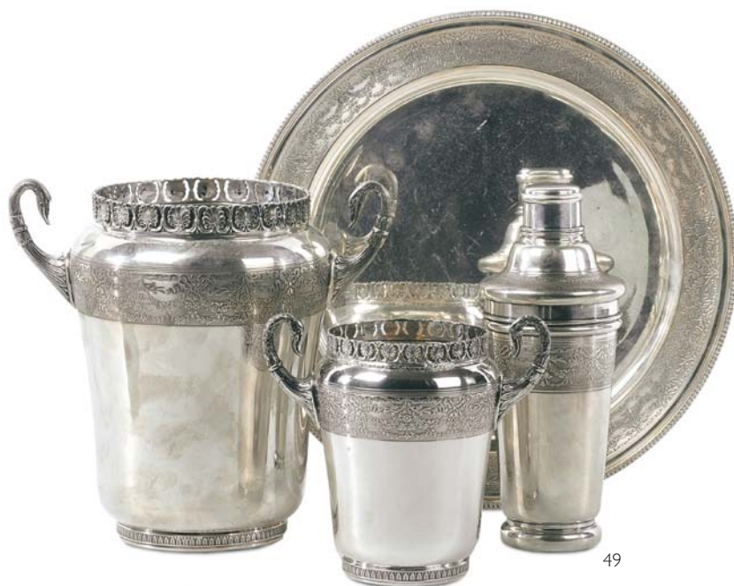
49 LOTTO DI OGGETTI IN ARGENTO MARCHIATI CACCHIONE, XX SECOLO composto da piatto, shaker, portagiaccio, portabottiglie, gr. 3239 circa € 2.500 - 2.800