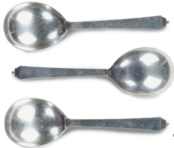
58 SERVITO DI POSATE IN ARGENTO MODELLO CARAVEL, DISEGNO DI HENNING KOPPEL PER G.JENSEN, COPENAGHEN XX SECOLO gr. 5158 circa € 4.000 - 5.000