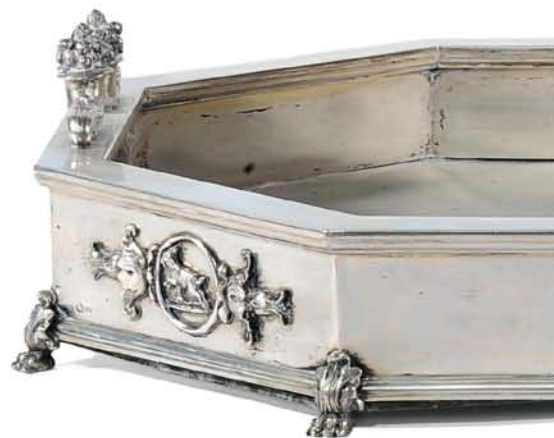
93 GRANDE PIATTO OTTAGONALE IN ARGENTO diametro cm 38, gr. 1200 € 400 - 500