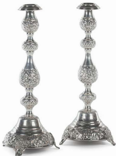
160 COPPIA DI CANDELIERI IN ARGENTO, LONDRA 1918 gr. 947, altezza cm 35 € 1.500 - 1.700