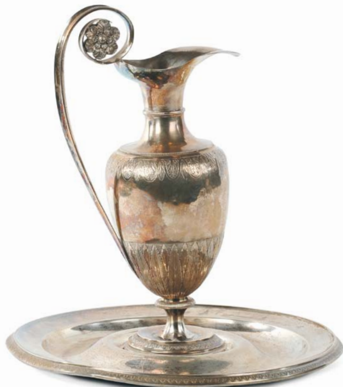
164 VERSATOIO IN ARGENTO CON PIATTO, ITALIA XIX SECOLO decoro a palmette e fiori di gusto neoclassico, altezza cm 28, gr. 850 circa € 800 - 1.000