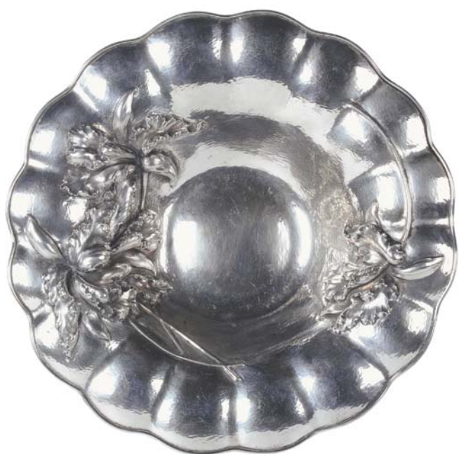
158 GRANDE PIATTO IN ARGENTO SBALZATO CON FOGLIE A RILIEVO gr. 1860 € 700 - 800